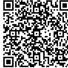
NBS IPS QR

Уколико у поље за износ унесете исти појавиће вам се NBS IPS QR и можете плаћање извршити телефоном.